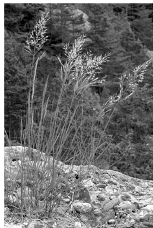
Abb. 3: Das Rauhgras ( Achnatherum calamagrostis ) ist ein typischer Besiedler der besonnten feinerdearmen Blockoberflächen.