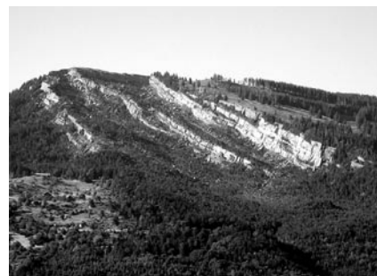
Abb. 1: Das Abbruchgebiet des Goldauer Bergsturzes oberhalb von Goldau

Neben Gesteinsaufschlüssen ist der Goldauer Bergsturz ein ideales Anschauungsobjekt für die Neubesiedlung eines jungen Bergsturzstandortes. Bei früheren wissenschaftlichen Untersuchungen standen dabei a) die Dokumentation der aktuellen Vegetation und die Diskussion ihres Zustandekommens und b) die Erfassung der mittel- bis langfristig ablaufenden Vegetationsveränderung im Vordergrund. Im Rahmen der Bestandesaufnahme wurden die Wälder im Talgrund und am Bergsturzhang bereits untersucht. Ebenfalls bearbeitet wurden die Blockstandorte in den unteren Bergsturzteilen (GRUNDMANN 2001, GRUNDMANN 2000; vgl. dort zitierte Literatur). Die Blockstandorte im mittleren und oberen Bergsturzhang (> 800 m) hingegen wurden bislang keiner eigenen Bearbeitung unterzogen. Diese Lücke wird hier geschlossen. Ferner bot sich die Gelegenheit, gleichzeitig die auffallend gleichmässig verlaufenden, flachen Nagelfluhplatten, die