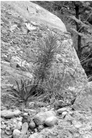
Abb. 2: Typische Kleinlebensgemeinschaft auf einem Block mit Jungföhre, Hasenohr-Habichtskraut ( Hieracium bupleuroides ) und Horstsegge ( Carex sempervirens ).

Carex sempervirens Sesleria coerulea Achnatherum calamagrostis Calamagrostis varia Hieracium bupleuroides Thymus polytrichus Polygala chamaebuxus Tortella tortuosa Schistidium apocarpum