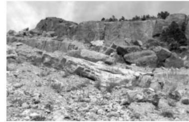
Abb. 7: Wiederbesiedlung eines frischen Rohbodenstandortes in der zweiten Vegetationsperiode nach dem Abbruch.

nen Flächen klein sind, ergeben sich durch solche Ereignisse immer wieder frische Rohbodenstandorte für eine Neubesiedlung (Abb. 7). Der Bildvergleich in Abb. 8 zeigt eindrücklich, wie sich das Gelände unterhalb der Abbruchkante am Gnipen (1550 m) im Laufe der Zeit verändert hat. Selbst nach 200 Jahren konnten sich dort nur wenige Baumindividuen etablieren. Aber auch die nicht von neuen Abbrüchen beeinflussten Block- und Felsstandorte im oberen Bergsturzgebiet werden Extremstandorte bleiben, die auch langfristig kaum von Bäumen, Sträuchern oder krautigen Pflanzen besiedelt werden. Eine deutliche Weiterentwicklung ist erst dann zu erwarten, wenn der umgebende Wald so dicht geworden ist, dass die Blöcke in den Genuss eines ausgleichenden Waldklimas kommen, analog jener Verhältnisse, die heute am unteren Bergsturzhang anzutreffen sind.